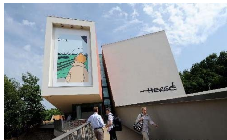
“丁丁之父”埃尔热博物馆正式对外开放

● 5 月 25 日，在比利时首都布鲁塞尔西南 30 公里的新卢万，埃尔热博物馆经过两年建设，于 6 月初正式对外开放。埃尔热是比利时著名漫画家，其系列作品《丁丁历险记》中的主人公丁丁和小狗“白雪”已经成为世界闻名的漫画形象。