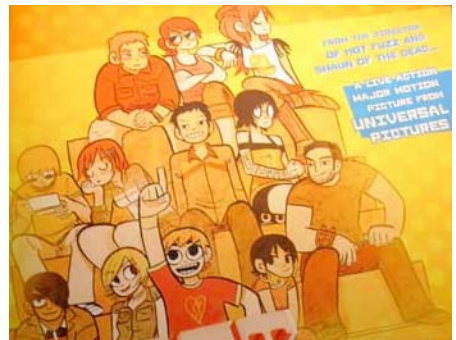
美国漫画《歪小子斯科特》将被搬上大银幕

● MARVEL 漫画公司日前公布了四部旗下根据超级英雄漫画改编电影的宣传 LOGO，同时公布了公映日期。这四部电影分别是《钢铁侠 2》(Iron Man 2)、《雷神托尔》(Thor)、《美国上尉》(Captain America) 和《复仇者》(The Avengers)。《钢铁侠 2》上映日期为 2010 年 5 月 7 日；《雷神托尔》上映日期为 2011 年 5 月 20 日；《美国上尉》上映日期为 2011 年 6 月 22 日；《复仇者》上映日期为 2012 年 5 月 4 日。目前《钢铁侠 2》正在拍摄中，其余的三部依然还没有正式开拍。