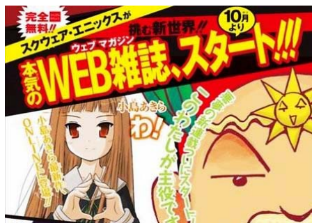
日本著名网络漫画志将推出系列单行本

● 日本著名游戏厂商 Square Enix 所经营的免费在线漫画杂志《GANGAN ONLINE》全力出击，将于 7 月 22 日将人气最高的连载作品一举单行本化。目前在线连载的漫画作品有十部以上，同时连载的还有两部轻小说。2008 年 10 月开载的后藤博之的人气作品《舞勇传》等，全部都是网络首发的原创作品。通过这次的单行本化，这些网络作品将展开它们转战纸质媒介的历程。Square Enix 是拥有《最终幻想》、《勇者斗恶龙》、《王国之心》等顶尖游戏的制作商，近年除了游戏外也涉足其它领域，漫画杂志和相关产品的经营是它主要业务中的一环。