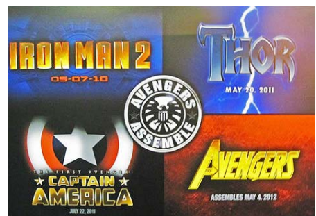
Marvel 英雄漫画改编电影四部齐发