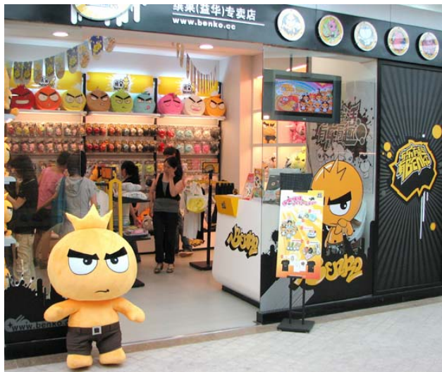
经过几年的连锁加盟运营,缤果有了 300 多家直营店和加盟店