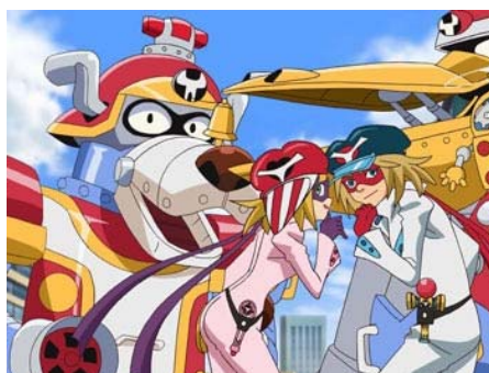
《小双侠》动画版也将被搬上大银幕