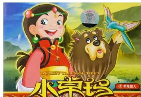
动画电影《精灵女孩小卓玛》5 月 27 日上映

● 5 月 27 日，由 52 集动画连续剧《小卓玛》改编的动画电影《精灵女孩小卓玛》在全国各大院线上映。这是一部童话、神话相结合，并富有趣趣性的影片，讲述了主人公小卓玛和她的伙伴与邪恶势力斗智斗勇，保护藏羚羊群的故事。影片特邀著名作