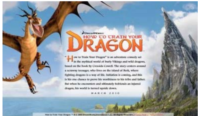
《驯龙记》等 7 部动画将于 2010-2012 年间以 3D 立体版上映

除了以上新片外，梦工厂还将从《克鲁德》(The Croods)，《运输家》(Truckers) 和《超级秘密鬼魂》三个项目中选择一个在 2012 年 11 月 12 日上映。