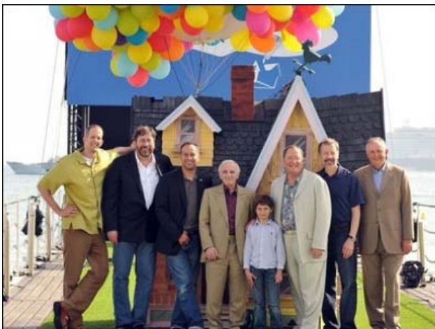
《飞屋环游记》主创人员赴戛纳电影节参展