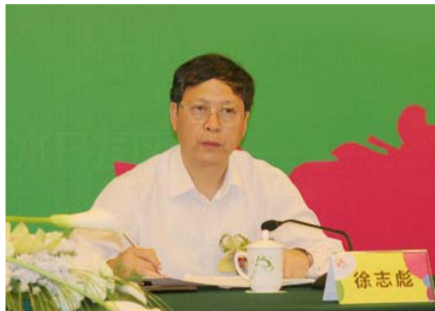
广州市副市长徐志彪介绍第二届中国国际漫画节筹备情况

据悉,第二届中国国际漫画节将于2009年8月底举行。目前,第二届中国国际漫画节执行单位广州