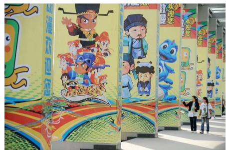
两名参观者走过中博会的动漫宣传展板

● 4月26日，第四届中博会国际动漫展在安徽国际会展中心开展，创意动漫秀、全新的互动体验等精彩纷呈的活动，让参观者在零距离的接触中品味动漫文化带来的全新体验。来自安徽、河南、山西等中部6省数十家动漫基地、动漫企业集中展示了一批具有自主知识产权的动漫产品，成为中博会上的一大亮点。据悉，国际动漫展由商务部等国家八部委和中部六省共同主办，是中博会的重要板块之一。