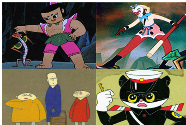
我国有着丰富的传统文化，为动漫提供了大量创作源泉