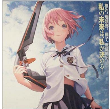
新的 GONZO 将继续制作《香格里拉》等动画

● 4月1日，日本动画制作公司 GONZO 宣布，由于没有在 3 月 31 日财政年底改善其财政，公司将在东京证券交易所停牌。尽管停牌，GONZO 仍然可以继续运作。同时，原 GONZO 的创立人之一，也是该公司的总经理、GDH 的董事会成员村滨章司在自己的 BLOG 里面声明，为了制作动画，他将成立一家新的公司。新公司命名为 LAMBDA FILM 株式会社，由村滨本人担任董事长。他表明，这一次将回归自己原本的理念，并不翼望于成为一家大型企业，只希望能够从事一份让自己充满感动的事业。据悉，GONZO 是由村滨章司、前田真宏、樋口真嗣等人在 1992 年组建的，之后更是与 DIGIMATION 合并，发展成为 GDH 公司，由村滨担任董事长。无奈 2008 年 9 月因 GDH 亏损严重，导致被强制收购，GONZO 也遭到并购。今年 4 月，GDH 正式与子公司 GONZO 合并，并将公司名称再次变更为 GONZO。