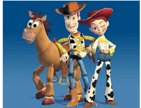
两部《玩具总动员》3D 版本将于 10 月连映

● 迪士尼近日正式宣布今年 10 月 2 日将以两片连映的形式在美国本土推出皮克斯名作《玩具总动员》与《玩具总动员 2》的 3D 版本。而原先迪士尼曾打算在今年 10 月 2 日先推出《玩具总动员》3D 版，到明年 2 月 12 日再推出《玩具总动员 2》3D 版。从迪士尼角度讲，这次上映策略的调整其实是给另外一部迪士尼 3D 影片《美女与野兽》让路。而原先《玩具总动员 2》的 3D 版则是与《美女与野兽》3D 版相冲突的。《美女与野兽》也将成为第一部被转制为 3D 立体电影的二维动画。