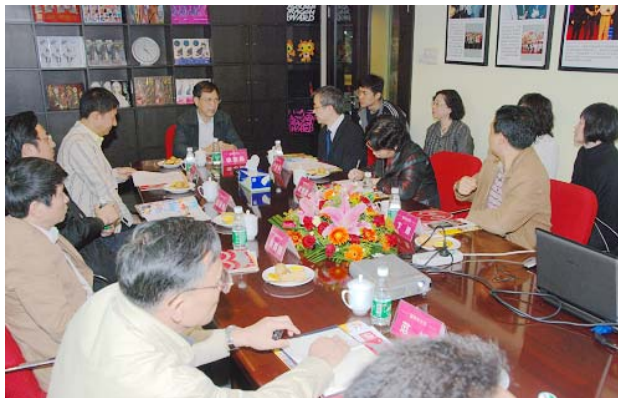
徐志彪副市长在漫友文化现场办公，与企业负责人深入交流

会上，徐志彪还对动漫企业的发展提出了“积聚、辐射”四字指导方针，要能积聚人才、汇集资源，不断做大做强，影响力要辐射到全国甚至是国外。同时他指出，当前国家统一部署保内需促增长，广州市经济的增长需要依靠现代服务业和创意产业的繁荣。因此，市政府非常关注、支持动漫产业的发展，各部门要加大对重点动漫企业的扶持力度，特别是在政策、资金和发展用地等各种软硬件方面，要不遗余力支持，以留住来穗发展的标杆式人才和企业，支持他们更加“高产”和“优产”。