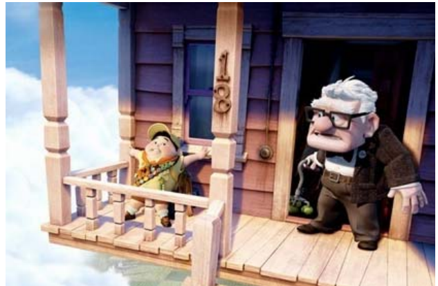
皮克斯新作《飞屋环游记》将于5月29日在北美上映

同时，电影获利的重要来源——周边产品销售也是让投资者担心的地方。沃尔玛最近就明确表示他们不会大规模储存《飞屋环游记》的系列玩具，因为他们认为一个以70多岁老人为主角的电影玩具对儿童缺乏足够的吸引力。很多投资者甚至担心《飞屋环游记》的周边产品获利甚至会低于《美食总动员》（在皮克斯所有动画中，《汽车总动员》周边产品销售最好，共创下了50亿美元的周边产品销售奇迹，而《美食总动员》周边产品销售最差）。