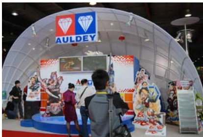
奥迪动漫玩具在展会现场倍受瞩目