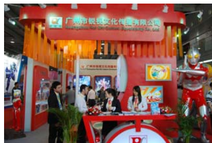
锐视文化在代理的基础上积极发展原创