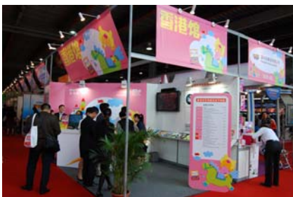
香港贸发局组织十余家企业集体参展

广东高乐玩具股份有限公司除展出“神奇魔术轮”、“电动企鹅”等颇为有趣的玩具外，展位也突出展示“正义红师”主题。21款仿真模型玩具布置成实战的场景，来自全国各地的经销商对该产品产生了浓厚的兴趣。该玩具系列由深圳市方块动漫文化发展有限公司独家授权高乐公司为中国大陆地区玩具总代理，负责销售八一电影制片厂拍摄的“正义红师”衍生玩具产品。