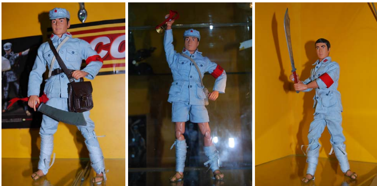
以解放军电影人物为原型的“正义红师”玩具，在设计上精益求精，每款都是按照真实装备1:18的比例设计制作。