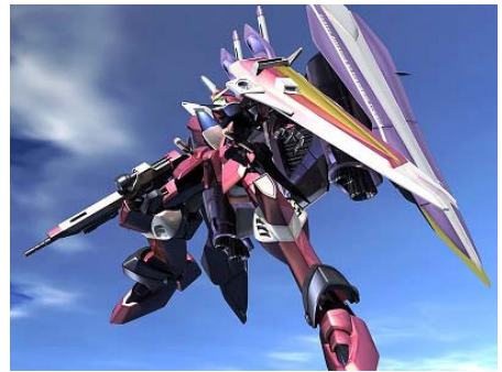
《高达》系列动画是 Sotsu 公司的收入支柱

● 近日，日本南梦宫万代发展股份有限公司（NAMCO Bandai Holdings）的广告公司 Sotsu 宣布了从 2008 年 9 月至 2009 年 2 月的第二季度的收入情况。该公司参与了大量的动画项目，由于电视节目和就业市场的不景气，与去年同期相比，公司收入和利润急剧下降。该季收入下降到 69.77 亿日元（6910 万美元），下降了 20.4%；利润至 9.91 亿日元（980 万美元），下降了 24%。在本季度中，Sotsu 负责了公司的主要项目，包括电视动画系列《高达 00》（第二季），以及《骷髅 13》、《守护甜心》等。《高达》系列仍是公司的支柱，但是其它动画却很少成功。本季度 11.35 亿日元（1120 万美元）的收入来自《高达》，但其它动画的收入只有 2.02 亿日元（200 万美元）。