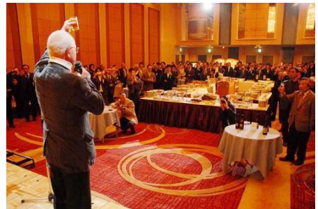
“日本百名漫画家忆停战日”将赴中国巡展

● 4 月 4 日，《日本百名漫画家忆停战日》漫画集中文版出版大型纪念会在东京浅草举行。该画集日文原题“我的八月十五日”是由柳 TAKESHI、赤塚不二夫、森田拳次等 100 多位日本著名家合作的大型漫画集，记录了这些漫画家在幼年时代所经历的日本战败日，以唤起人们对战争的反思。画集原作预定从 8 月 13 日起在中国进行巡回展出，在参展的 130 余部漫画中，除了漫画集中记录战争体验的“我的 8 月 15 日”外，还将有漫画家们展望未来的“2100 年 8 月 15 日”等部分作品。